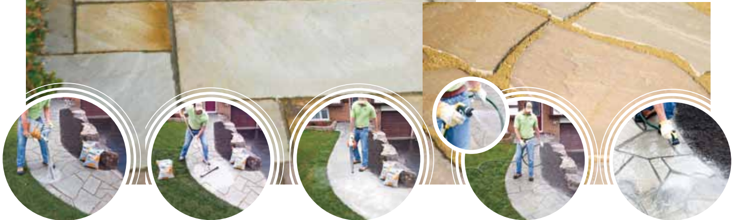
1. Sack ausschütten