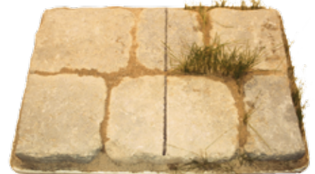
mit EnviroSAND® Herkömmlicher Fugensand